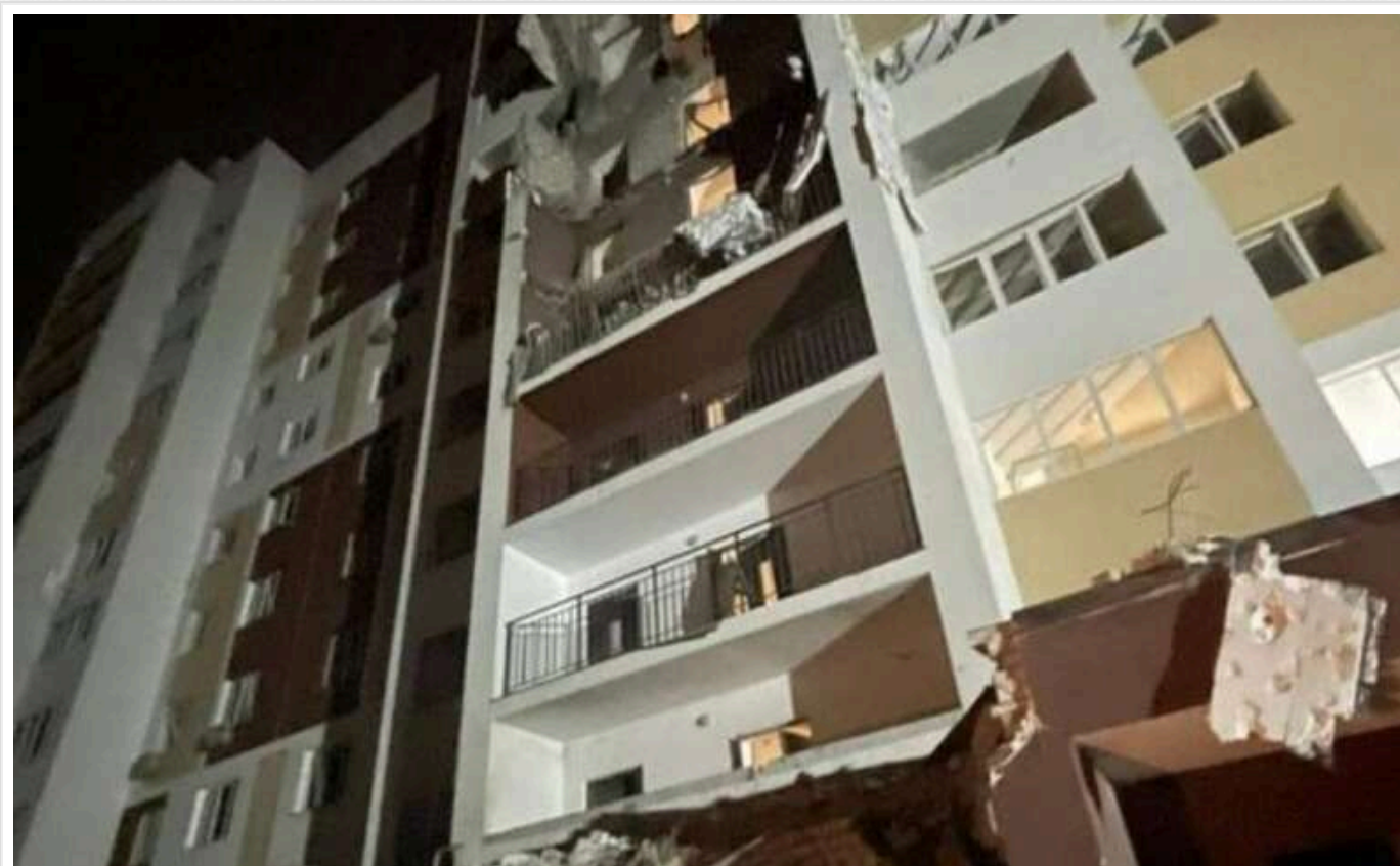
На Київщині внаслідок атаки окупантів пошкоджено багатоповерхівку, горіло підприємство

У Київській області в двох районах внаслідок російської повітряної атаки було пошкоджено житлову багатоповерхівку, а також сталася пожежа на виробничому підприємстві. Постраждалих немає.