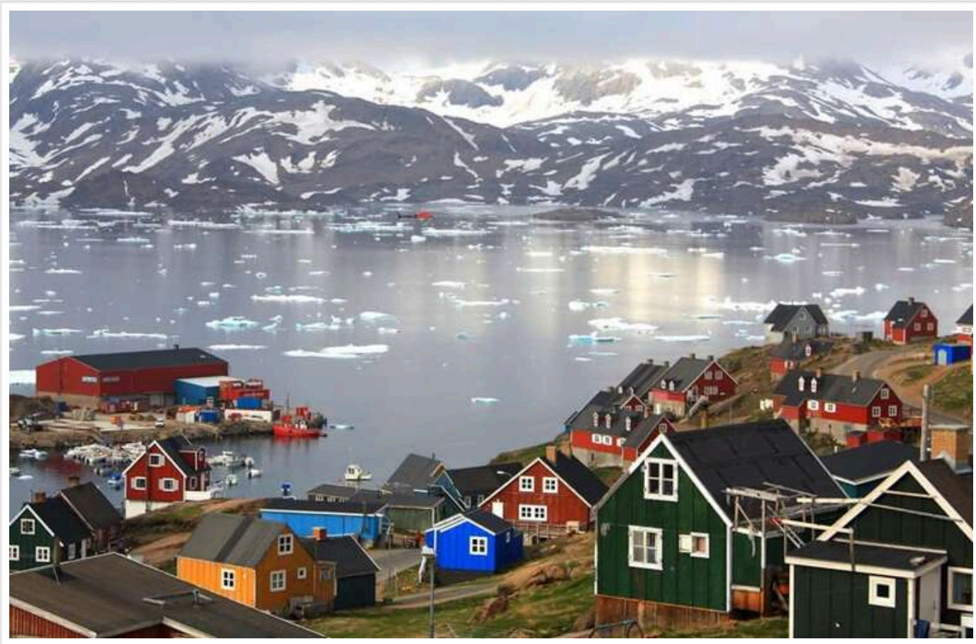
Данія і США домовилися обговорити питання Гренландії пізніше

Міністр закордонних справ Данії Ларс Лекке Расмуссен погодився зі своїм американським колегою Марко Рубіо обговорити питання Гренландії пізніше.