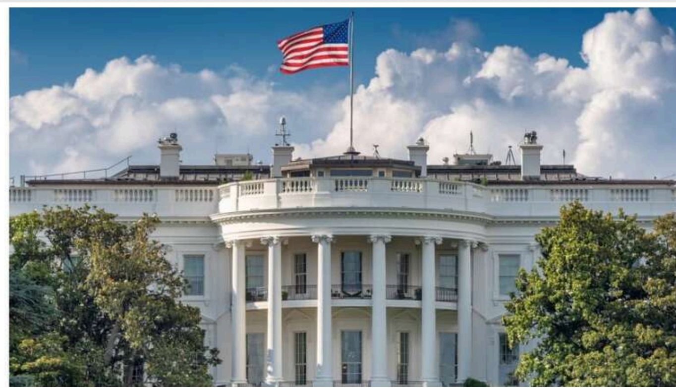
Держдеп США тимчасово призупинив іноземну допомогу, включаючи Україні: журналіст заперечує

Американська допомога Україні призупинена на три місяці. Через 85 днів держсекретар Марко Рубіо представить Дональду Трампу звіт, у якому буде зазначено, чи доцільно Вашингтону відновлювати підтримку Києва.