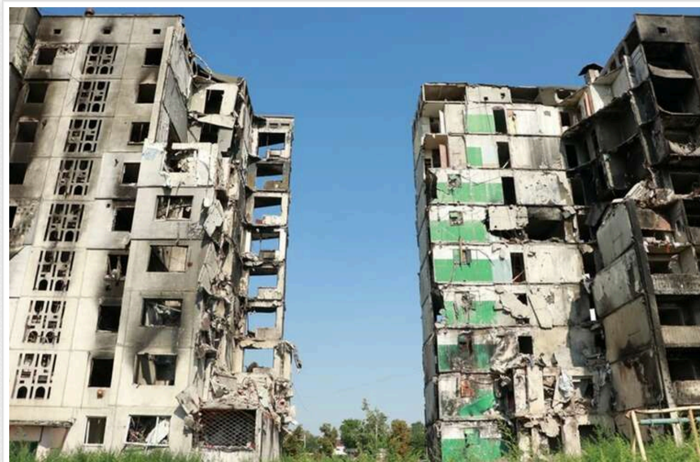
Півтора мільярда на відновлення Бородянки: як переможці тендерів пов'язані з екскмером Ірпеня та новим головою податкової

Значну частку великого, півторамільярдного державного замовлення на відбудову Бородянки, віддали компаніям, що привели журналістів до оточення екскмера Ірпеня Володимира Карплюка та нового очільника податкової служби, а донедавна голови КОДА Руслана Кравченка.