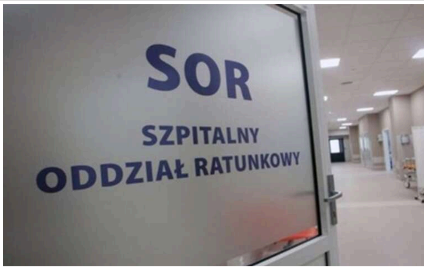
Смерть українки в Польщі після відмови в допомозі у відділенні невідкладної допомоги: медсестрі загрожує до 5 років позбавлення волі

У Польщі українка померла після відмови в допомозі у відділенні невідкладної допомоги. Після того як інцидент набув широкого розголосу в ЗМІ, керівництво лікарні ініціювало внутрішнє розслідування. Було виявлено, що медсестра не виконала свої обов'язки, не здійснивши первинну оцінку стану пацієнта, яка є ключовою процедурою для визначення пріоритету надання допомоги.