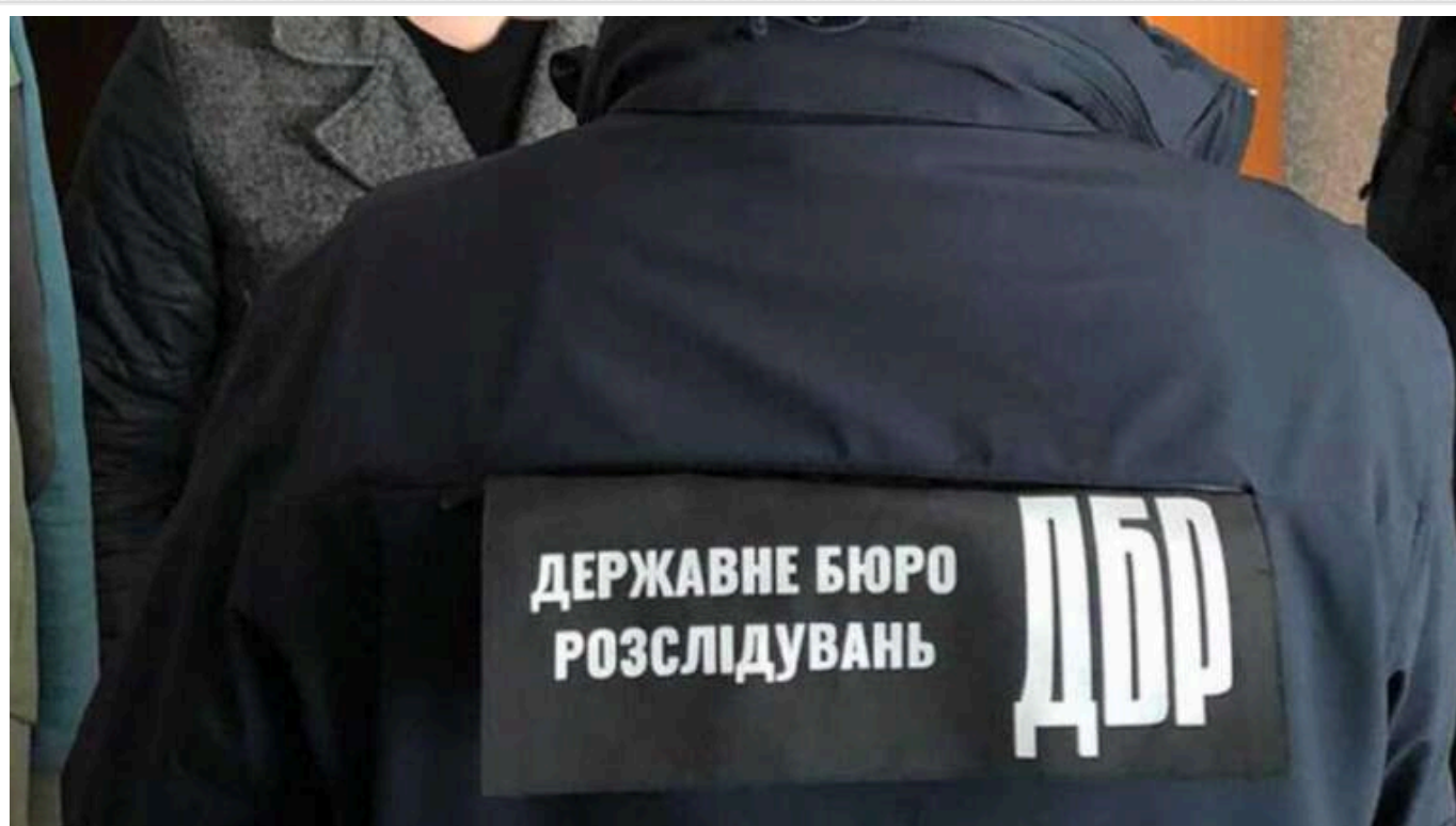
За незаконне збагачення колишньому митнику "світить" 10 років ув'язнення

Експіробітника Львівської митниці підозрюють у незаконному збагаченні – він придбав необґрунтовані активи – земельні ділянки, автомобілі тощо – на суму понад 12 млн грн. За це йому загрожує, серед іншого, від 5 до 10 років позбавлення волі.