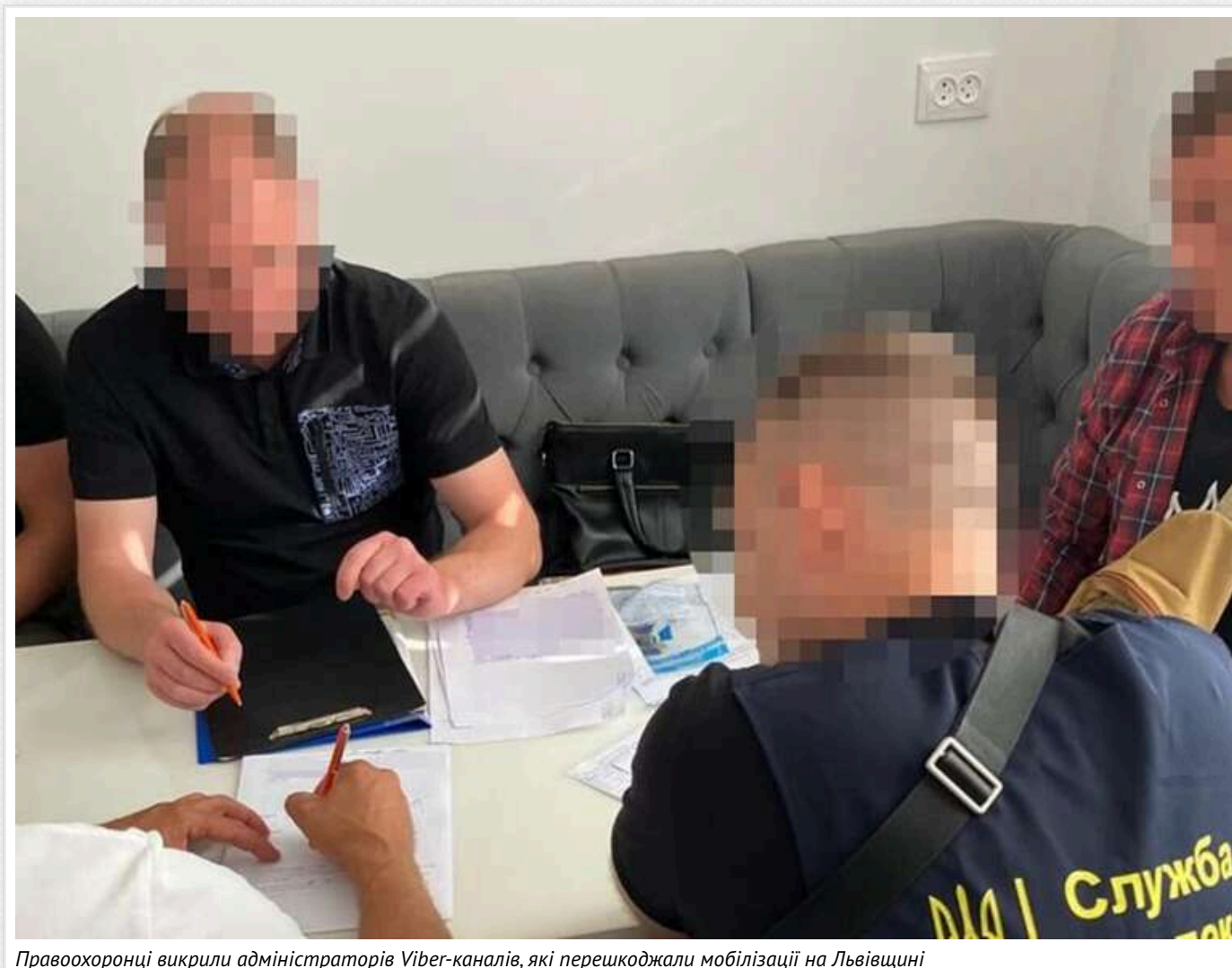
Правоохоронці викрили адміністраторів Viber-каналів, які перешкождали мобілізації на Львівщині

Фахівці з кібербезпеки Служби безпеки України викрили трьох адміністраторів каналів у месенджері Viber, яких підозрюють у перешкоджанні мобілізації у Львівській області. За даними слідства, ресурс із 22 тисячами підписників попереджав про переміщення працівників Національної поліції та військових ТЦК.