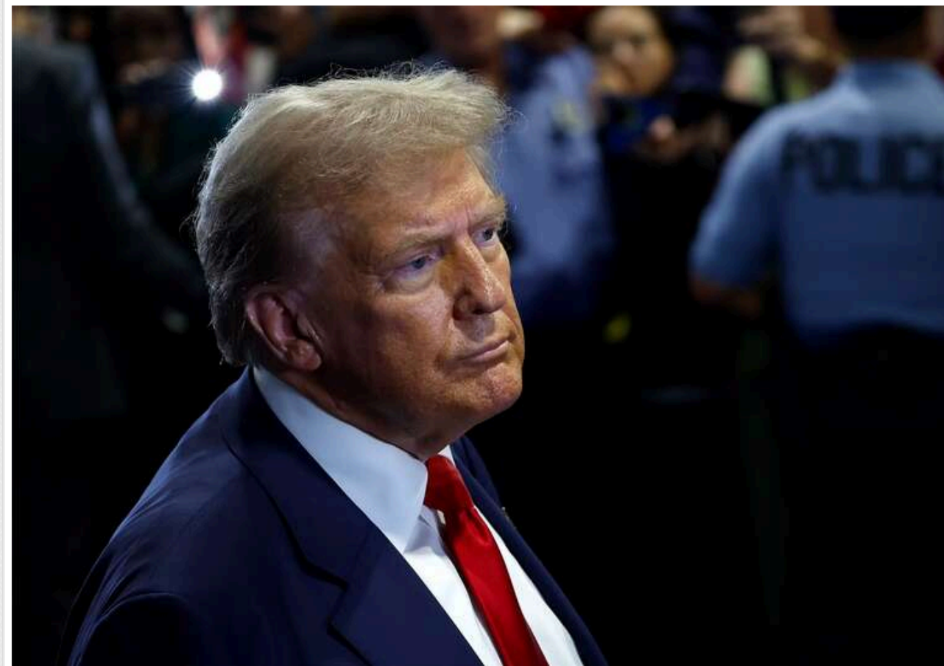
Вихід США з ВООЗ: як це позначиться на Україні

Одним із перших указів, підписаних Дональдом Трампом після інавгурації, став документ про вихід США з Всесвітньої організації охорони здоров'я (ВООЗ).