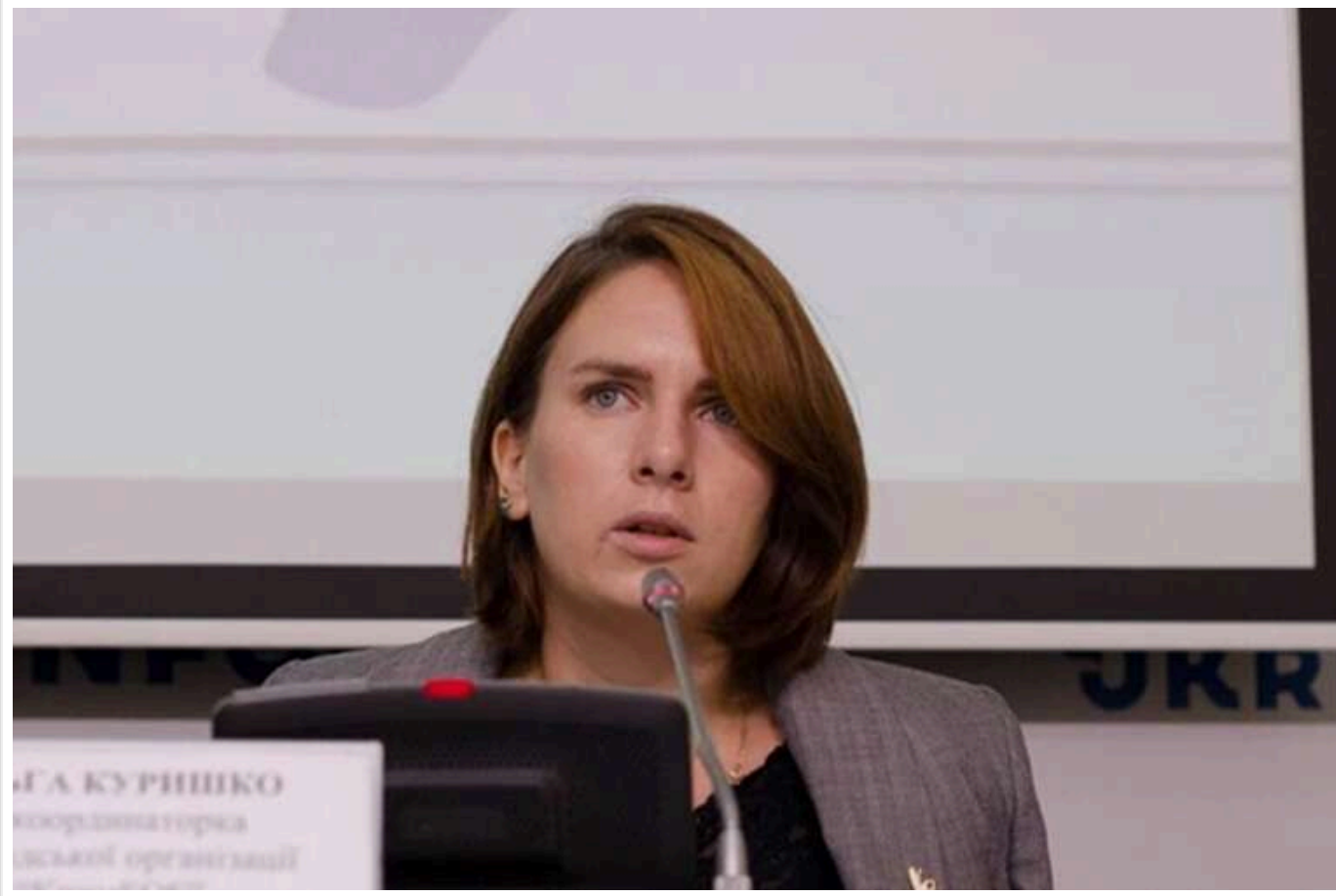
Зеленський призначив нового постійного представника президента в Криму

24 січня президент України Володимир Зеленський призначив Ольгу Куришко на посаду постійної представниці президента України в Автономній Республіці Крим.