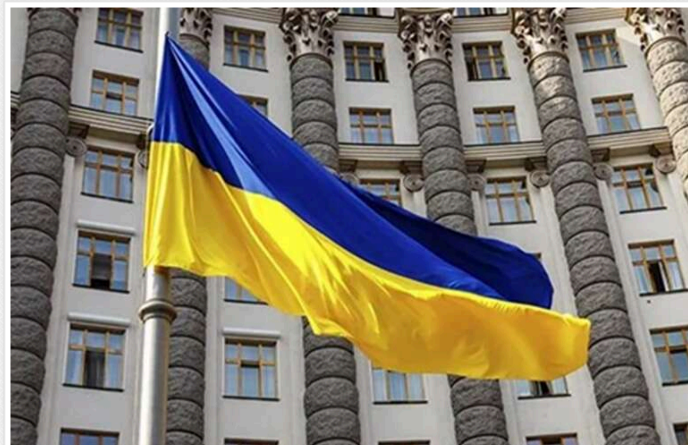
В Україні створили Агентство національної єдності

Після заснування Міністерства національної єдності кабінет міністрів ухвалив рішення про створення Агенції національної єдності.