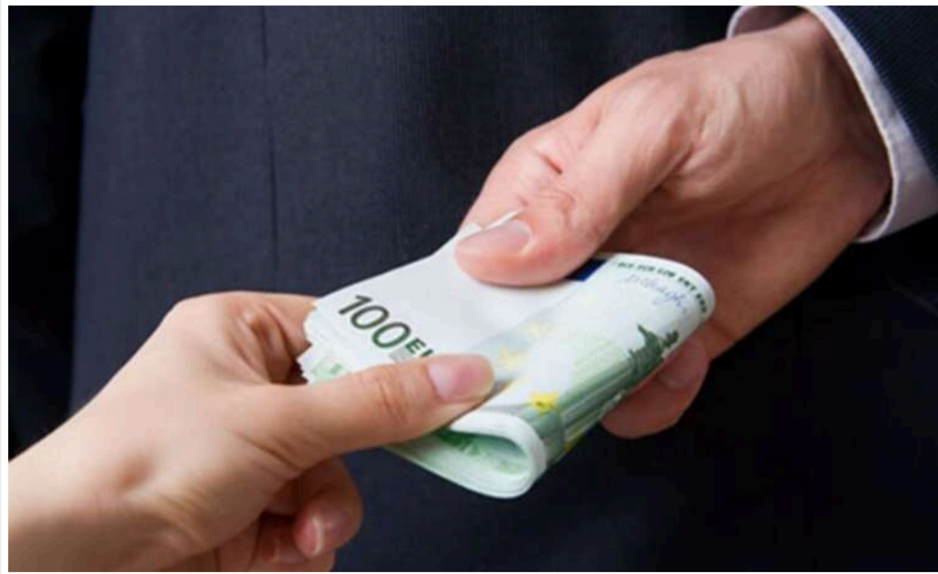
Опитування НАЗК: В Україні виріс рівень корупції

Більшість українців і підприємців вважають, що у 2024 році рівень корупції збільшився, показують результати опитування НАЗК.