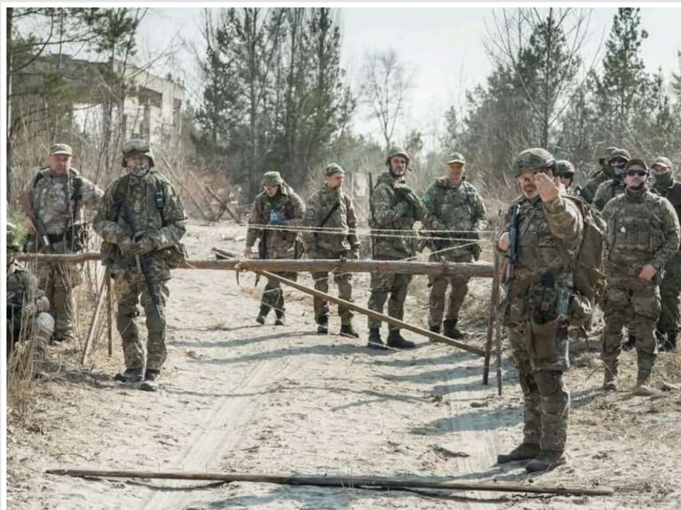
Затримані при спробі незаконно покинути Україну поїхали до Франції у складі скандальної 155-ї бригади, - ДБР

До Франції разом із сумнозвісною 155-ю бригадою, звідки за кордоном утекли десятки людей, вирушили та чоловіки, затримані в Україні при спробі незаконного перетину кордону, повідомляє ДБР.