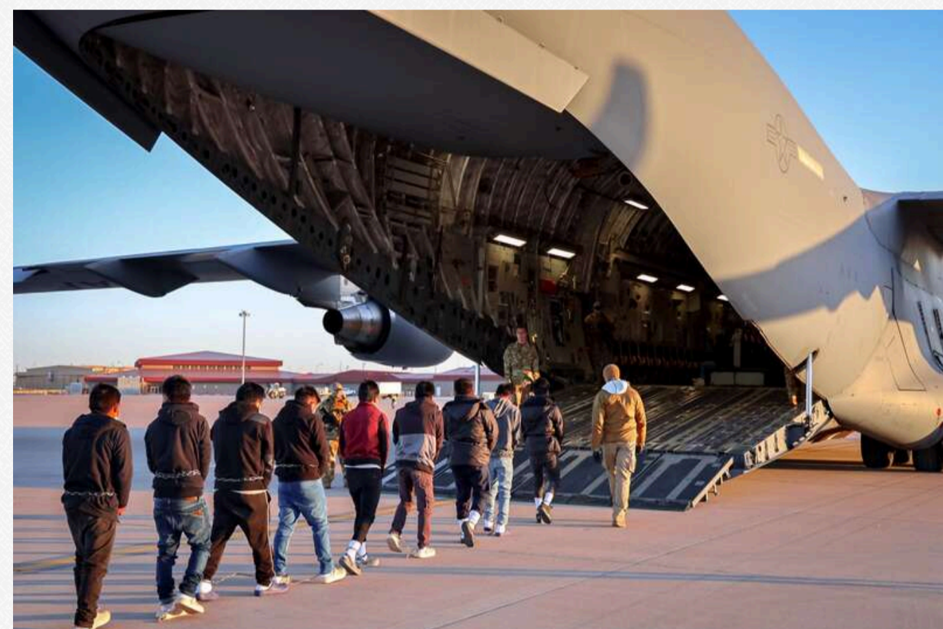
Фото: Лівітт опублікувала світлини, на яких видно, як люди сідають у військові літаки

Прессекретарка Білого дому Каролін Лівітт зазначила, що депортаційні рейси зі Сполучених Штатів Америки вже розпочалися.