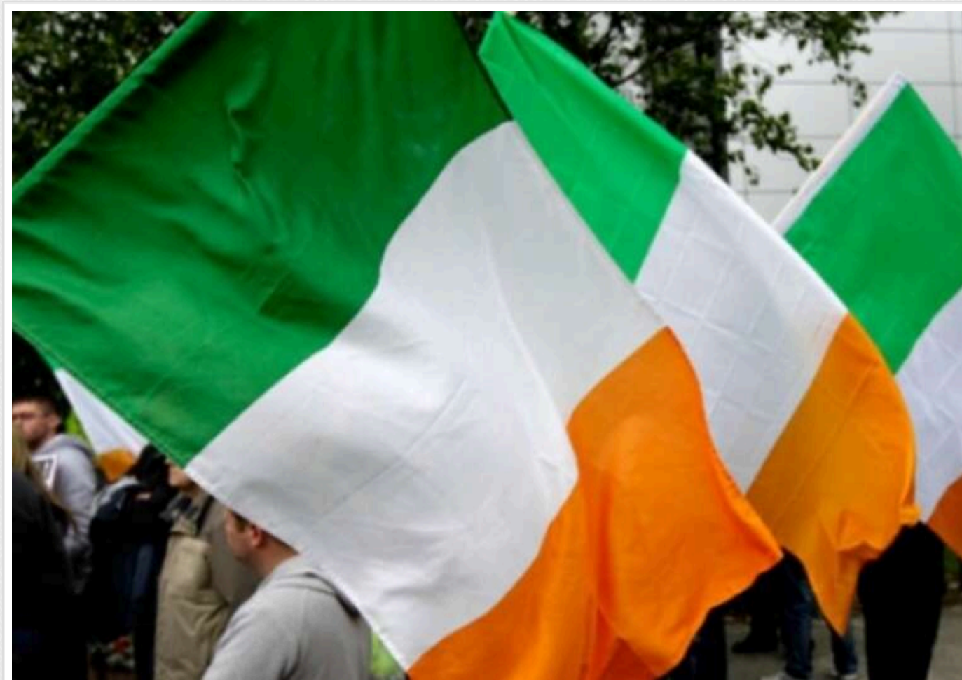
В Ірландії через шторм закривають усі школи й університети

В Ірландії та Північній Ірландії у п'ятницю всі школи та університети будуть закриті через потужний шторм, громадський транспорт також не працюватиме.