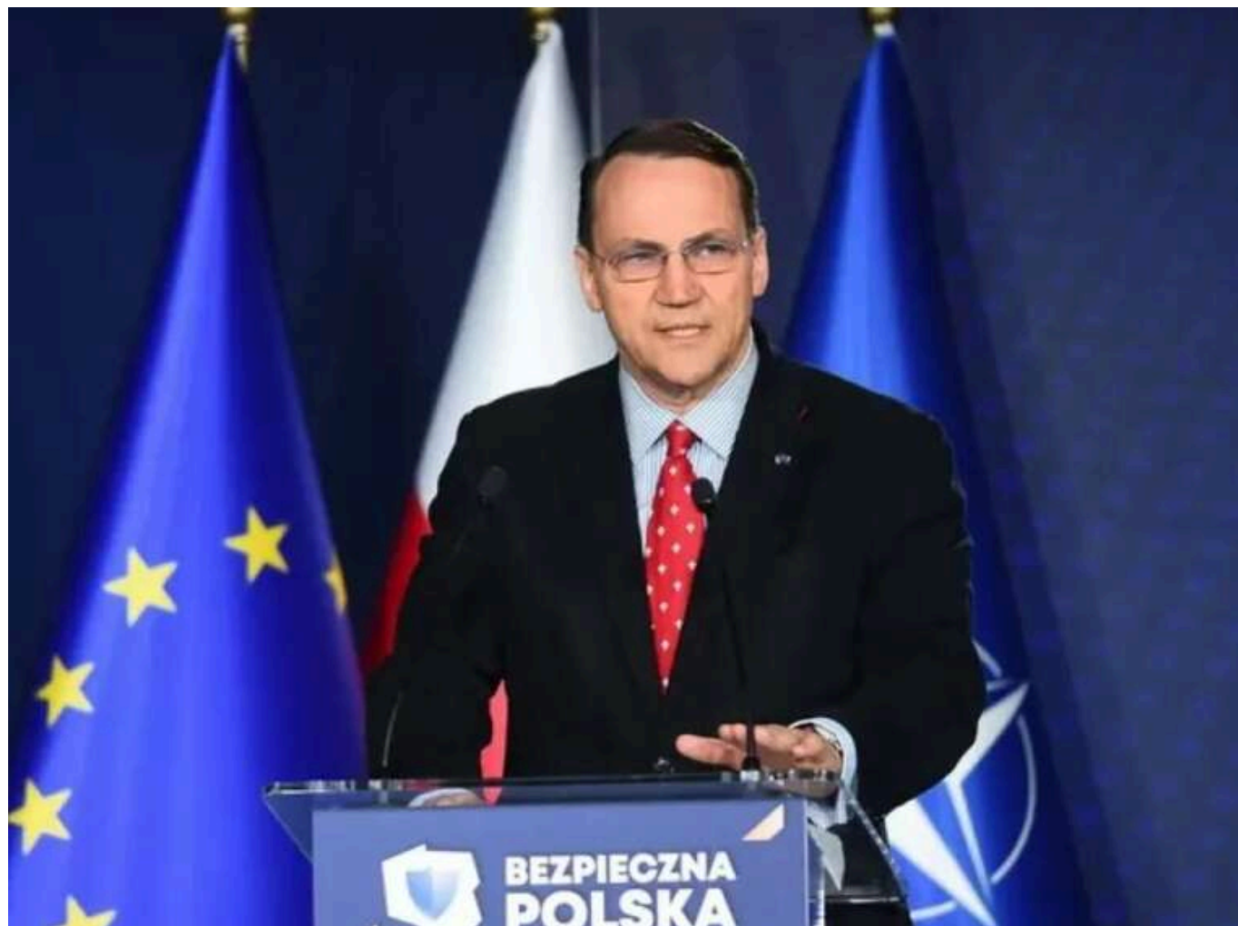
Поразка Росії у війні відповідає інтересам України, ЄС, США та російського народу, - Сікорський

Історія Росії показує, що щоразу, коли ця країна зазнавала тяжкої військової поразки, у ній починалися реформи та зміни. Отже, поразка Росії у війні з Україною є вигідною не лише для України, її партнерів та союзників, а й для самої Росії та її народу.