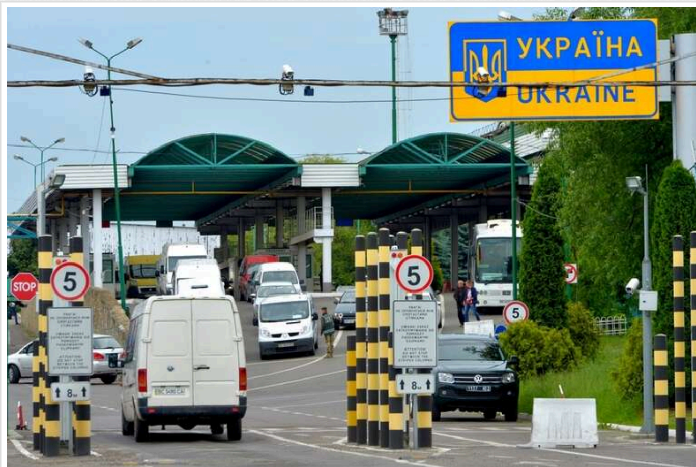
У Польщі внесли пункти пропуску до критичної інфраструктури, щоб уникнути блокад кордону

Уряд Польщі включив прикордонну інфраструктуру до переліку критично важливих об'єктів, щоб обмежити можливі спроби блокування українсько-польського кордону в майбутньому.