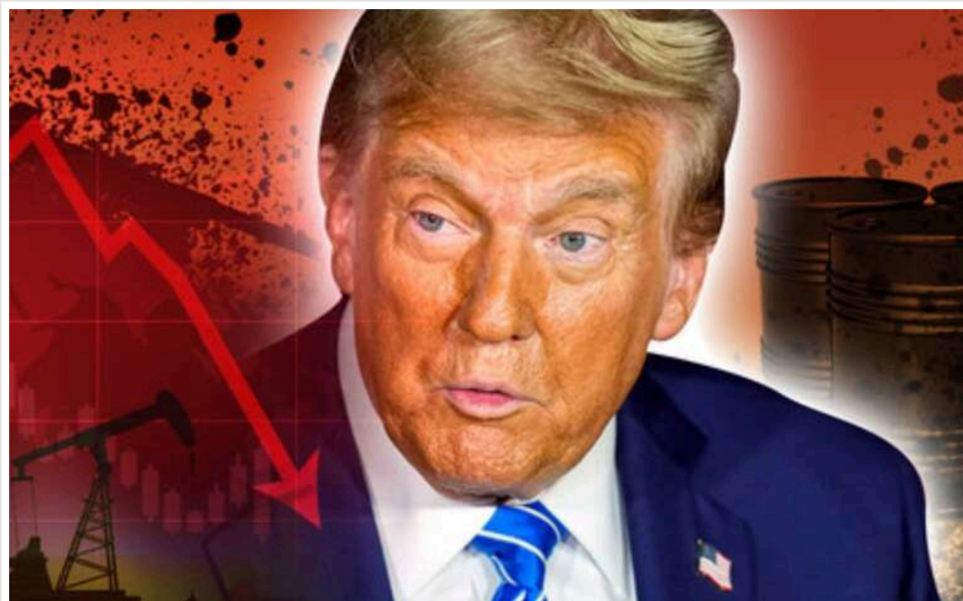
США планують обвалити нафтові ціни, щоб тиснути на економіку Росії

Нова адміністрація президента США Дональда Трампа планує посилити економічний тиск на Росію через її залежність від нафтового сектору. Ця галузь забезпечує понад половину експортних доходів країни та близько чверті податкових надходжень до бюджету.