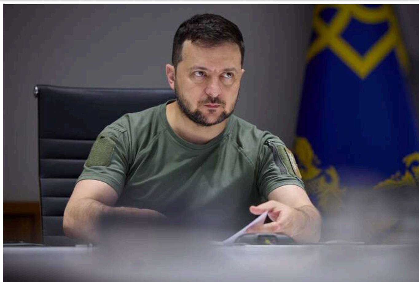
Президент Зеленський визначив один із найсуттєвіших ключів до досягнення миру

Зменшення цін на російські енергоресурси, зокрема на нафту, є одним із найважливіших чинників для досягнення миру. Основне - не зупинятися та чинити тиск на Росію.