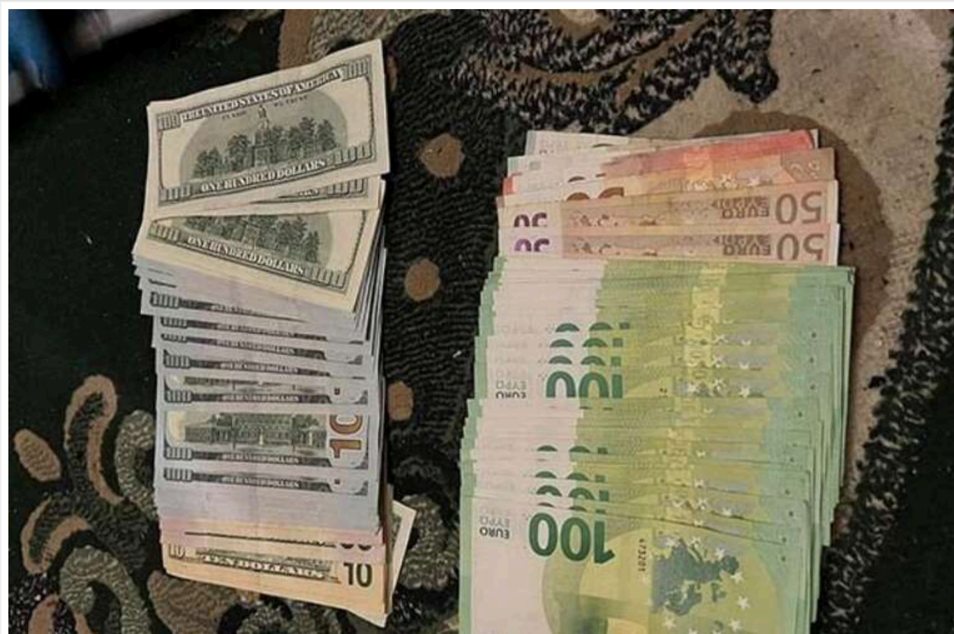
В Україні ліквідовано канал контрабанди наркотичних засобів, організований жителями Тернопільщини

Під оперативним супроводом працівників управління стратегічних розслідувань слідчі ГУНП у Тернопільській області спільно зі співробітниками УСБУ ліквідували канал контрабандного везення в Україну нарковмісних лікарських засобів. У ході спецоперації поліцейські припинили діяльність організованої злочинної групи, члени якої розповсюджували заборонені речовини серед наркозалежних жителів різних регіонів України.