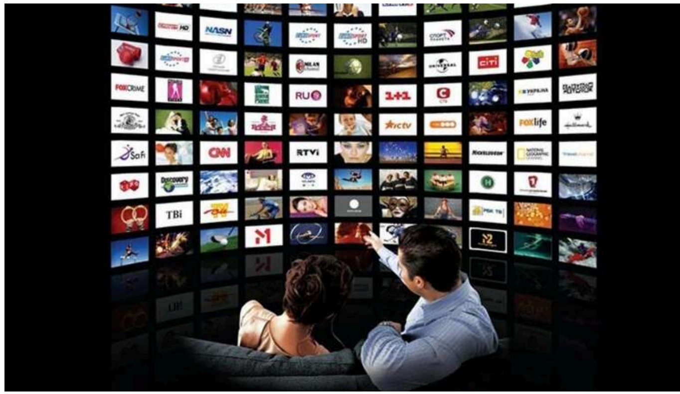
У Польщі TVP запускає нові програмні блоки для росіян, білорусів та українців

Польська телекомпанія TVP анонсувала запуск нових програмних блоків на каналі Bielsat, які почнуть мовлення з 1 березня.