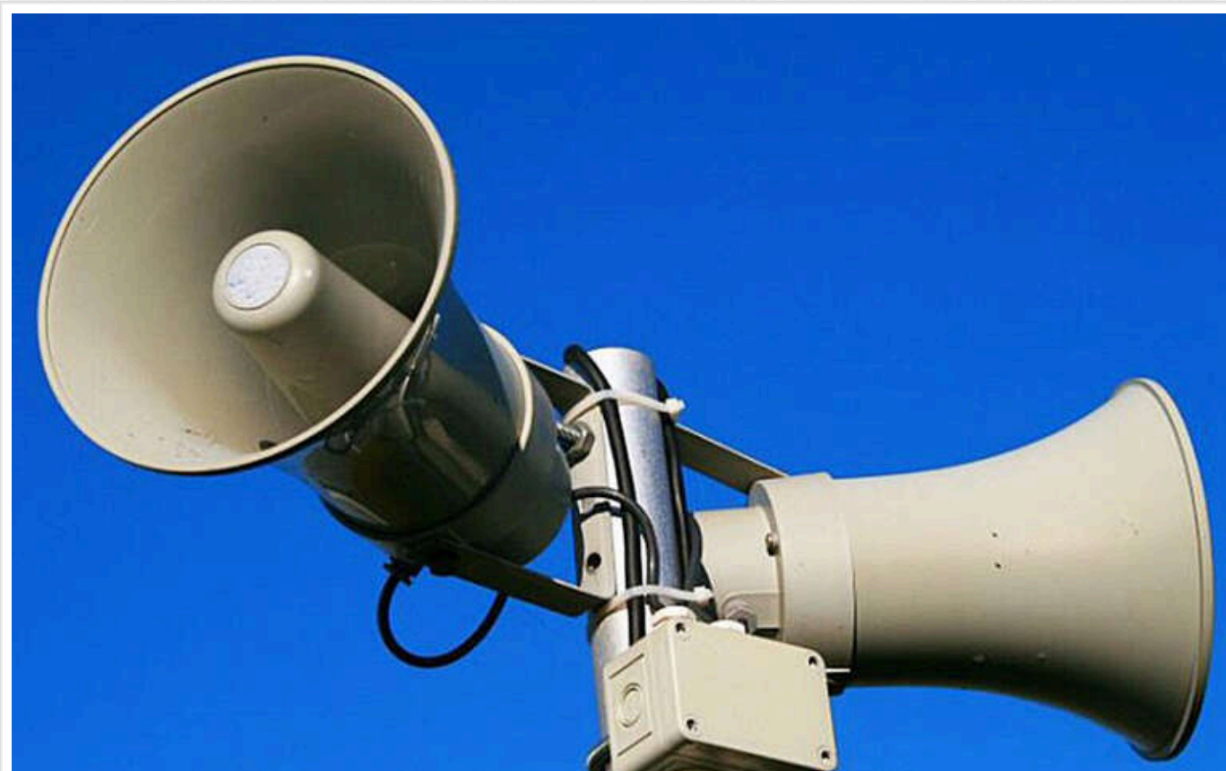
У Житомирській області розпочали тестування нової системи сповіщення про повітряну тривогу

Подібний проєкт був раніше запущений на Черкащині.