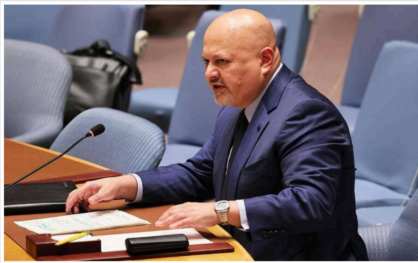
Головний прокурор МКС вимагає арешту лідерів «Талібану» за злочини проти людяності

Головний прокурор Міжнародного кримінального суду (МКС) Карім Хан звернувся з вимогою видати ордер на арешт лідерів «Талібану» в Афганістані.