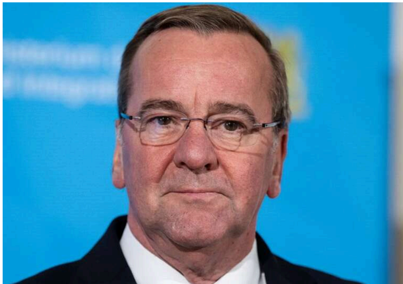
Якщо Україні не забезпечити тривалий мир, Путін може спробувати здійснити новий напад, - Пісторіус

Потрібно працювати над встановленням стійкого миру в Україні під гарантії її партнерів, інакше Росія може спробувати через кілька років відновити війну.