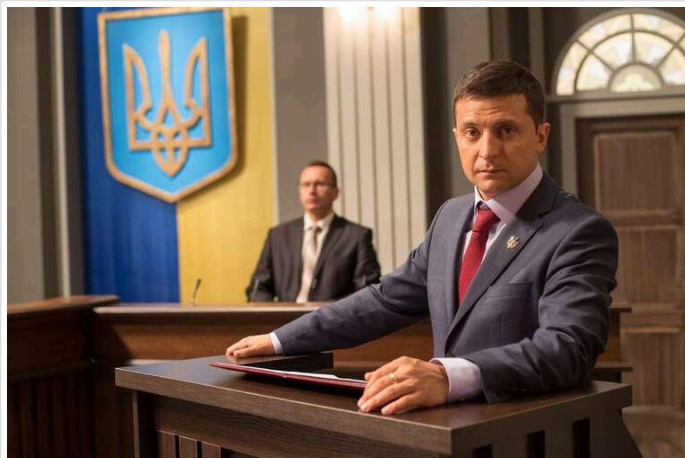
Режисер "Слуги народу" поділився, який кремлівський пропагандист допоміг йому продемонструвати фільм у Росії під час війни

Олексій Кірющенко, режисер і сценарист проєкту "Слуга народу", в головній ролі якого з'явився Володимир Зеленський, на той час – відомий актор і продюсер, а нині – президент України, вперше розповів, як презентував серіал у Росії. Подія відбулася вже під час війни – влітку 2019 року.