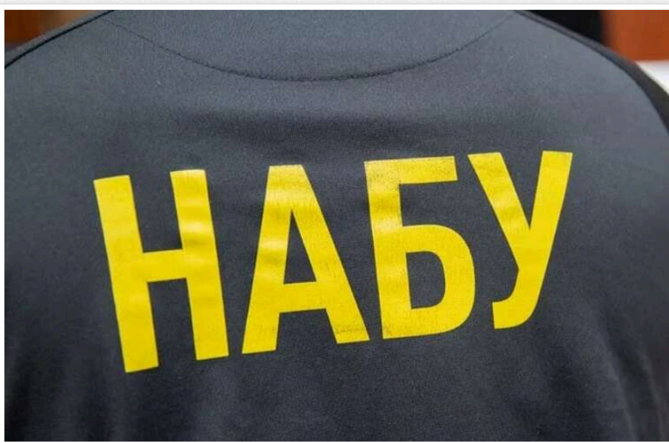
Детектив Денисюк, який розслідував корупцію під час закупівлі дронів, звільнився з НАБУ

Детектив НАБУ Андрій Денисюк, який займався розслідуванням зловживань на закупівлях дронів Держспецзв'язку, звільнився з Бюро.