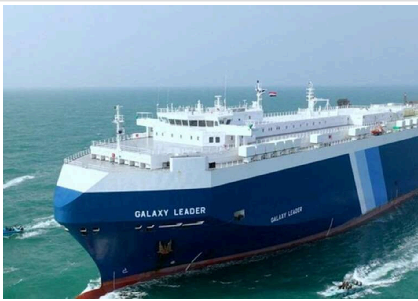
ГУР і МЗС евакуювали 3 українських моряків, які перебували в полоні у йеменських хуситів

Головне управління розвідки Міністерства оборони разом з Міністерством закордонних справ вивезли з полону трьох українських моряків, членів екіпажу вантажного судна Galaxy Leader, які перебували в руках єменських хуситів.