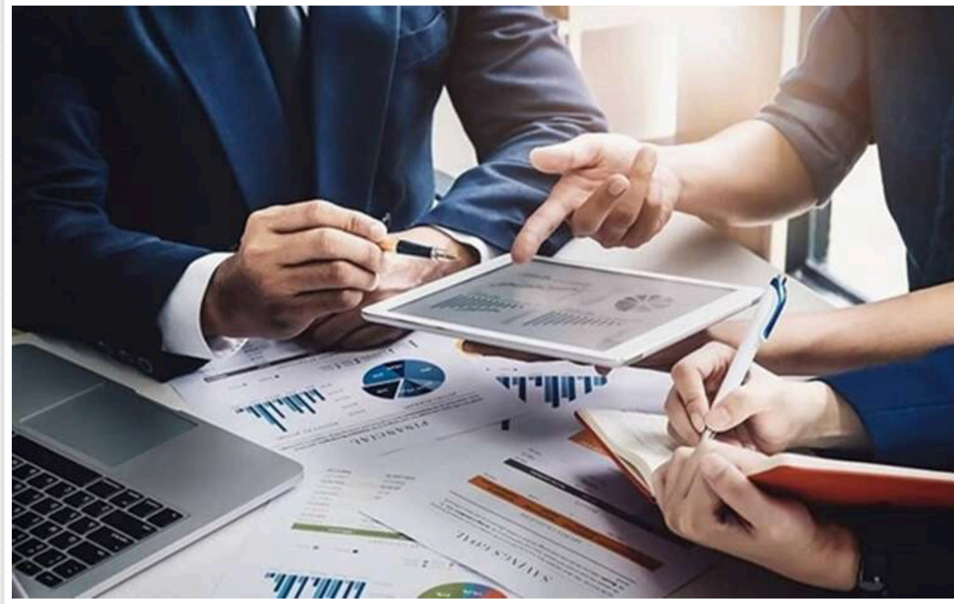
В Україні поменшало бізнесів іноземців

За даними Єдиного державного реєстру, у 2024 році було зареєстровано понад 1,1 тисячі нових компаній з іноземними власниками, що на 24,2% менше, ніж у 2023 році. Найбільше таких бізнесів відкрито в столиці, на Львівщині та Одещині. Минулого року найбільше компаній в Україні відкривали громадяни Туреччини, Польщі та США.