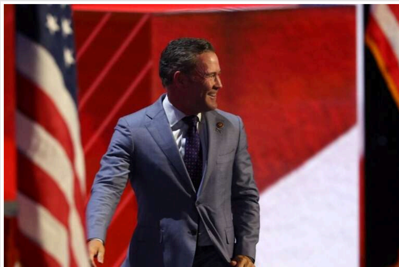
Волтц відсторонив від роботи десятки співробітників Ради нацбезпеки, відповідальних за Україну, Іран та КНДР

Радник Трампа з національної безпеки Майк Волтц відправив додому десятки співробітників Ради національної безпеки, які займаються питаннями України, Ірану і КНДР, відсторонивши їх від роботи.