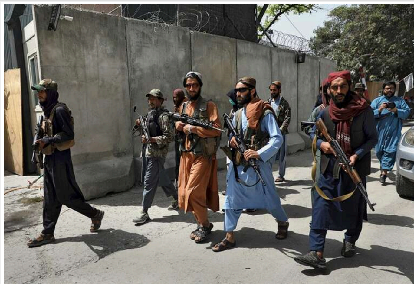
Таліби не планують повертати американське озброєння, незважаючи на вимоги Трампа

Афганський уряд, що представляє рух "Талібан", відхилив вимогу президента США Дональда Трампа повернути американську зброю, оцінену в мільярди доларів.