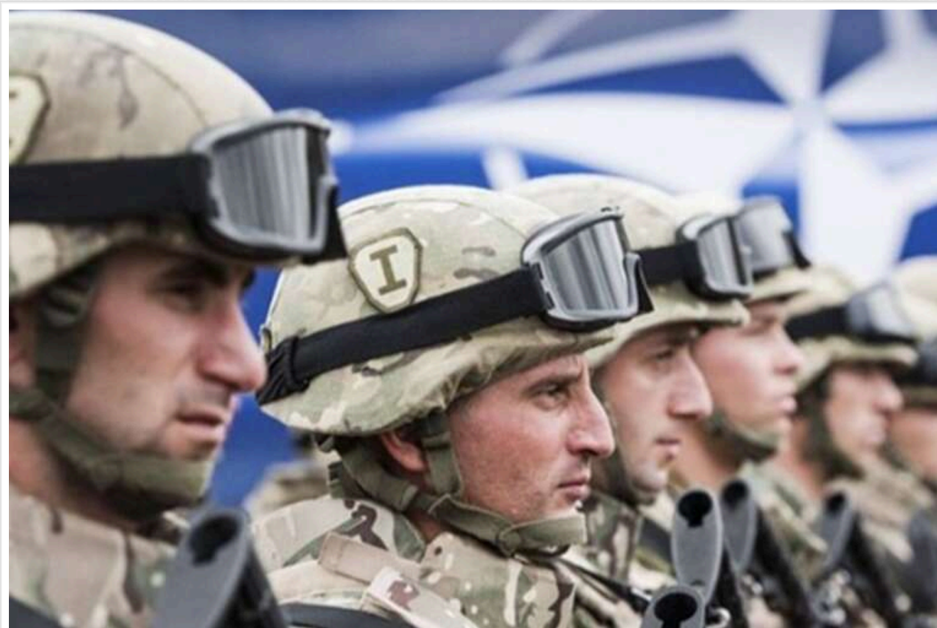
У FT повідомили, що чисельність західного контингенту в 200 тисяч миротворців в Україні абсолютно нереалістична

Озвучена Зеленським кількість західних миротворців, необхідна для України, в 200 тис. осіб є абсолютно нереалістичною, заявляє Financial Times.