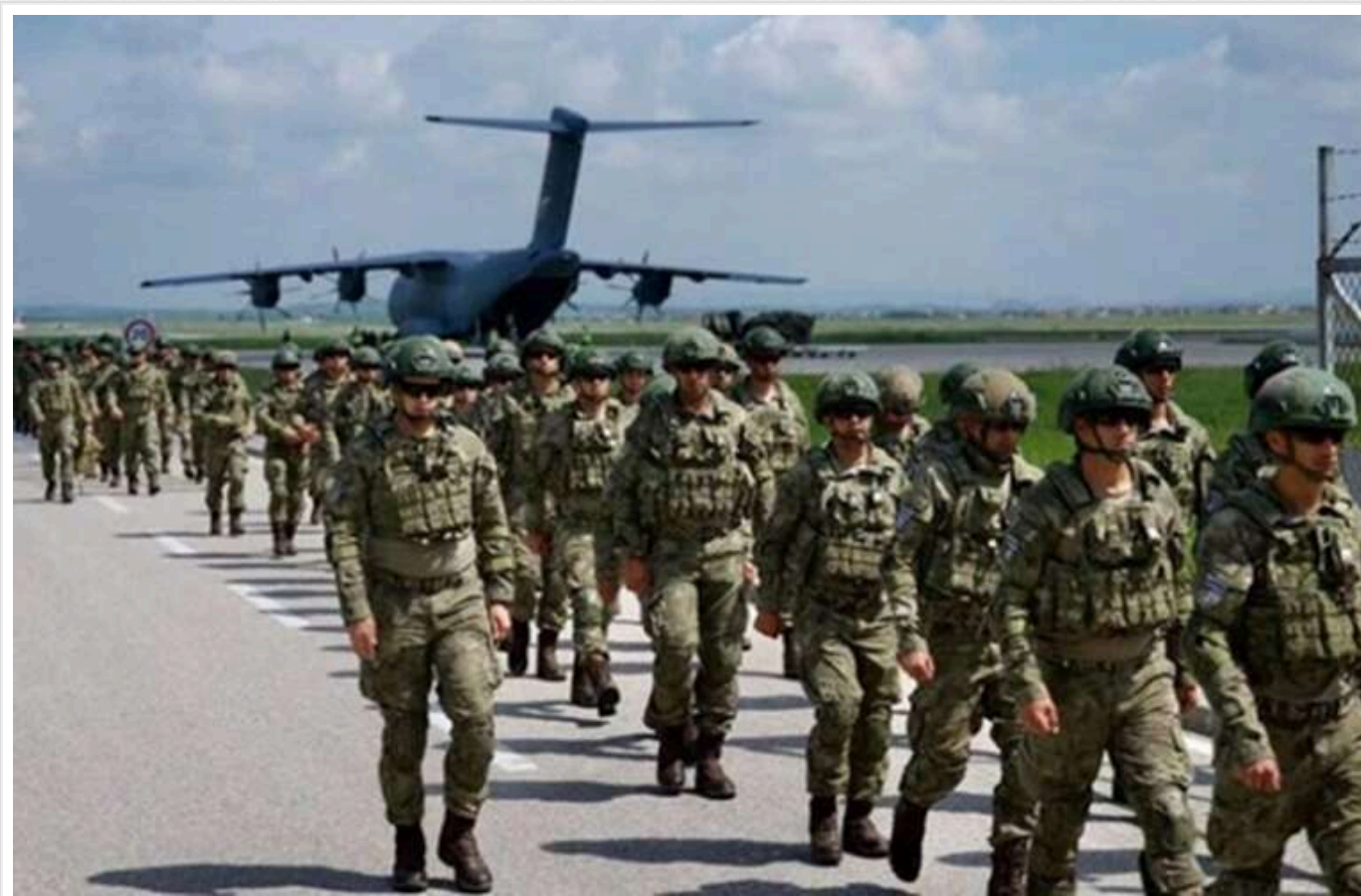
Україна очікує, що в разі припинення вогню Захід відправить 40-50 тисяч військових на 1000-кілометрову лінію фронту

Україна має очікування, що Захід відправить 40-50 тисяч військових на 1000-кілометрову фронтову лінію у випадку припинення вогню.