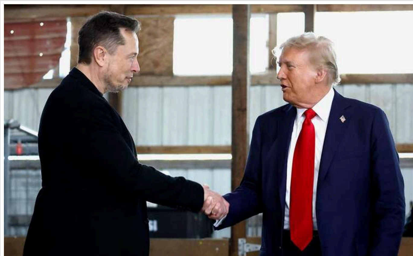
Маск розкритикував план Трампа щодо створення компанії StarGate для розвитку ШІ з інвестиціями в 500 мільярдів доларів