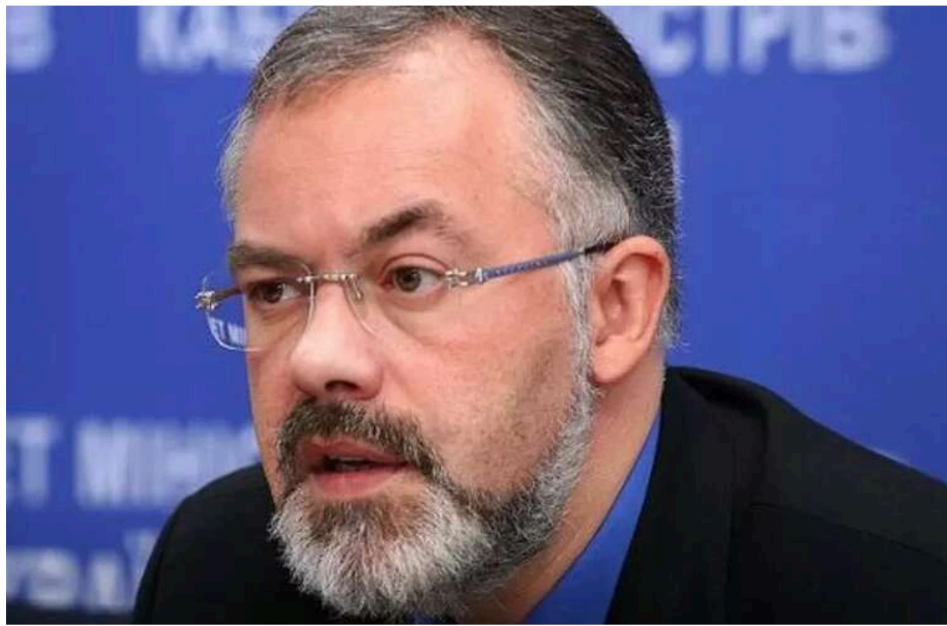
Вінницький апеляційний суд залишив без змін вирок Дмитру Табачнику: 15 років за держзраду

Вінницький апеляційний суд 20 січня залишив без змін вирок колишньому міністру освіти і науки України Дмитру Табачнику – 15 років ув'язнення з конфіскацією майна за державну зраду.