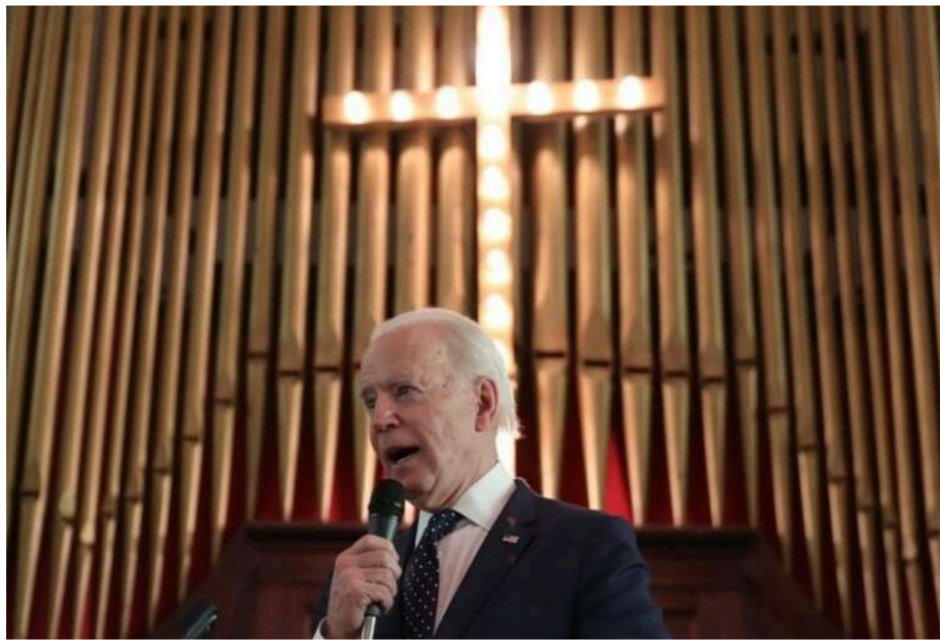
Байден має намір молитися про мир для Америки на майбутні роки

Стало відомо зміст листа, який колишній президент залишив Трампу в шухляді робочого столу.