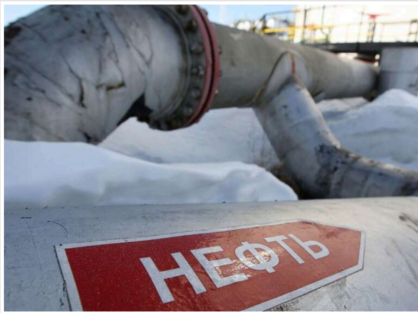
Санкції США проти російської нафти не призведуть до значного скорочення поставок, - аналітик Vortexa