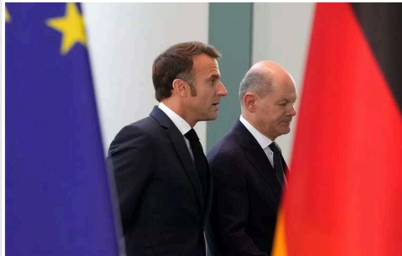
Німеччина і Франція не зменшать підтримку України, – Шольц