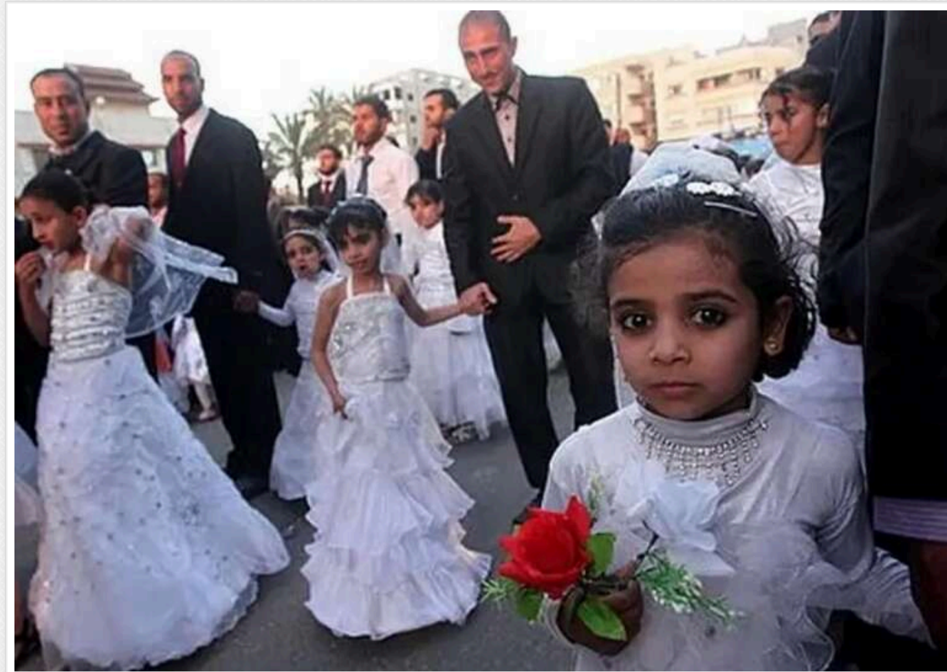
Guardian: В Іраку дозволили дитячі шлюби з 9 років

В Іраку дозволені дитячі шлюби з 9 років, заявляють противники влади, коментуючи нові закони, прийняті парламентом вчора.