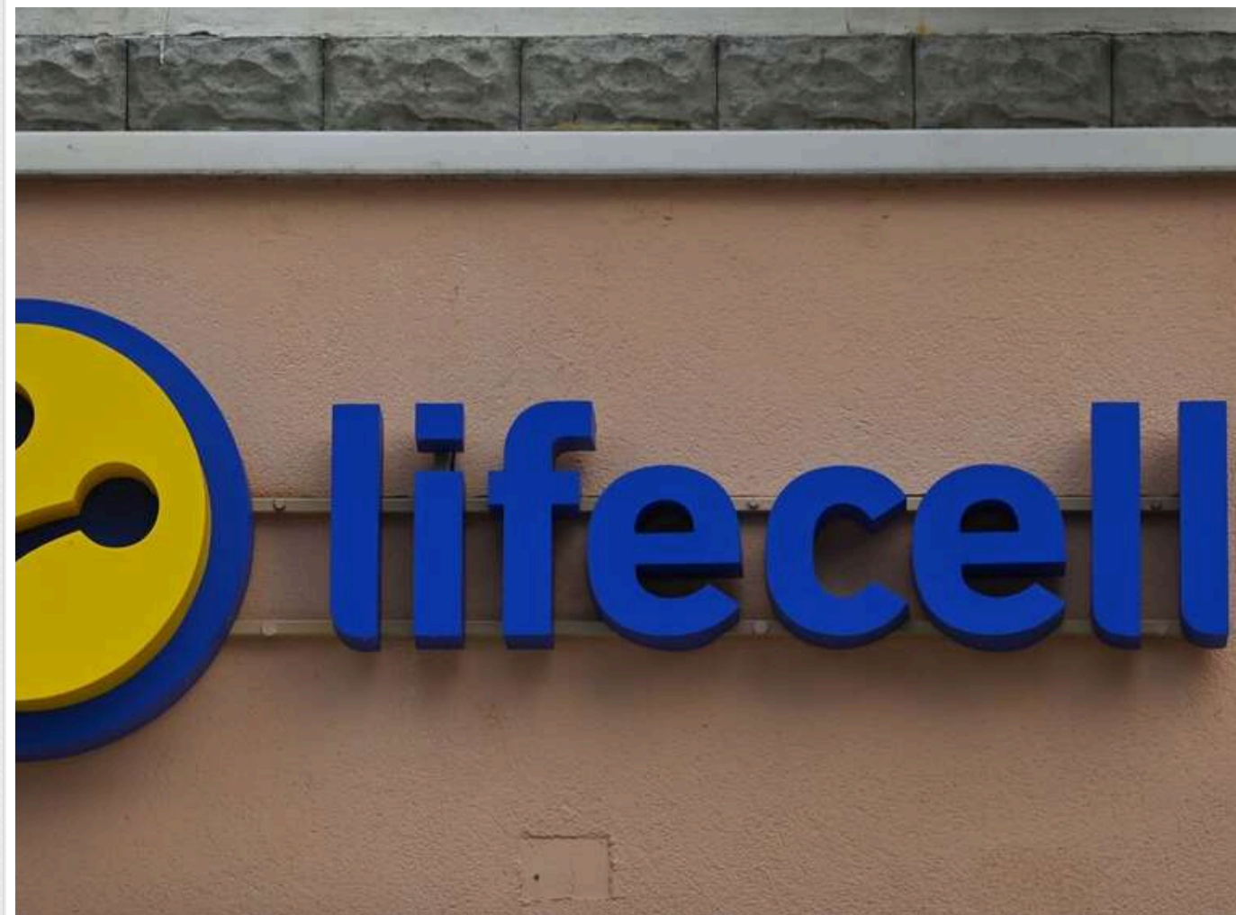
Ще один мобільний оператор підвищить тарифи

У лютому мобільний оператор lifecell підвищить тарифи. Однак це рішення не торкнеться абонентів, які перенесли свої номери в lifecell з кінця минулого року з мереж інших мобільних операторів.