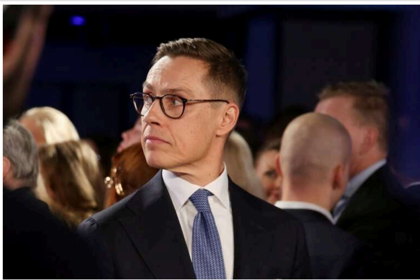
Президент Фінляндії розповів, коли Трамп досягне угоди по Україні

Трамп зможе досягти угоди щодо питання України протягом від трьох до шести місяців, висловив свою думку президент Фінляндії на форумі в Давосі.