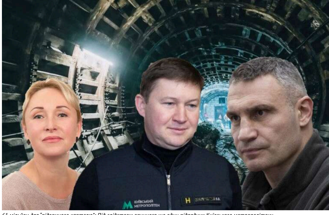
61 мільйон для "підземного картелю": Під слідством опинився ще один підрядник Київського метрополітену

У столицій Нацполіції розслідують факти заволодіння бюджетними коштами при проведенні першої черги капремонту тунелів Святошинсько-Броварської лінії метрополітену.