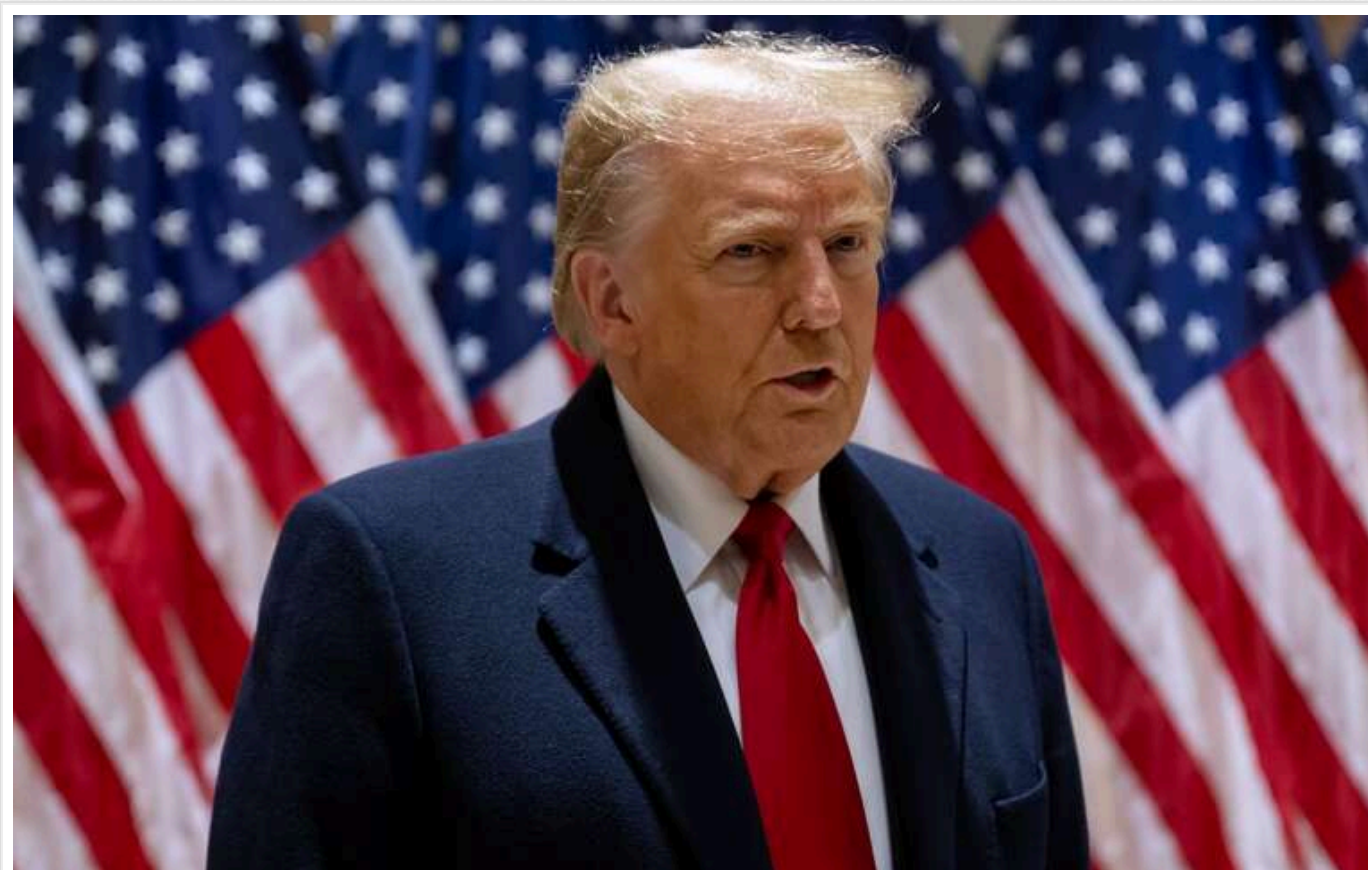
Шахраї вигадали нову схему: дурять українців виплатами "від Трампа"

Кібершахраї активізували зусилля, щоб обманути українців, і тепер "пропонують" їм отримати 6500 гривень від новообраного президента США Дональда Трампа. Сам політик, ймовірно, здивувався б, якби це почув, адже сам ніяких грошей для України не виділяв.