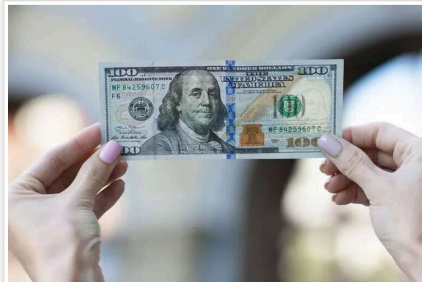
Український бізнес погіршив прогноз щодо курсу долара

Представники українського бізнесу погіршили свої очікування щодо курсу долара. Вони прогнозують, що у найближчі 12 місяців курс досягне 44,42 грн/долар, тоді як раніше очікували 43,72 грн/долар.