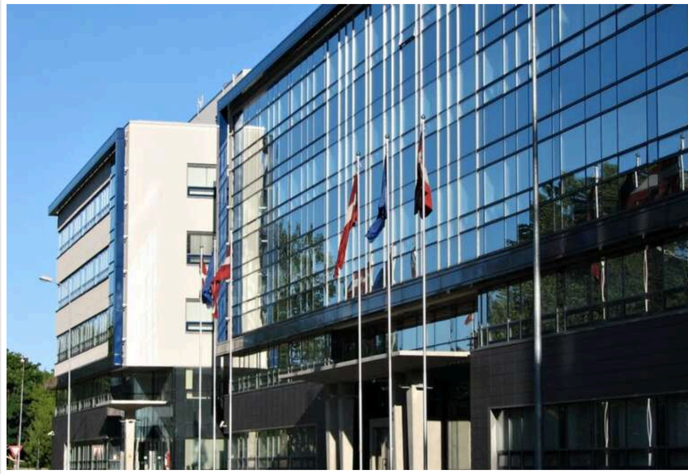
Латвійське МВС запропонувало заборонити росіянам і білорусам працювати на об'єктах критичної інфраструктури

Міністерство внутрішніх справ Латвії запропонувало внести зміни до закону про національну безпеку, які обмежать доступ громадян Росії та Білорусі до роботи на об'єктах критичної інфраструктури.