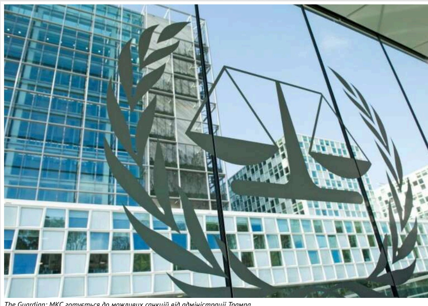
The Guardian: МКС готується до можливих санкцій від адміністрації Трампа

Міжнародний кримінальний суд (МКС) готується до можливості запровадження економічних санкцій з боку Дональда Трампа. Це може відбутися цього тижня після його вступу на посаду президента США.