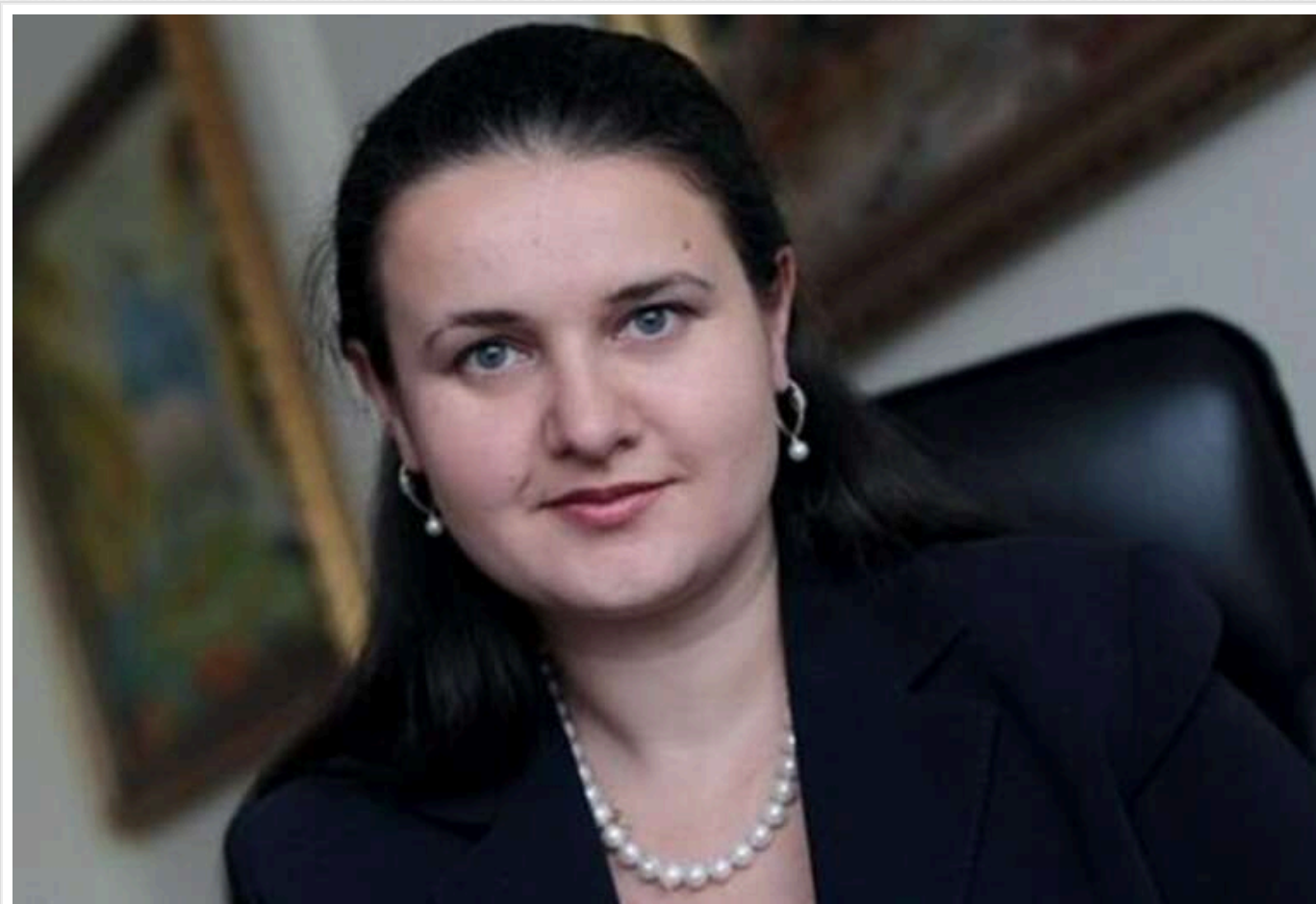
На інавгурації Трампа Україну представляла посол у США Оксана Маркарова