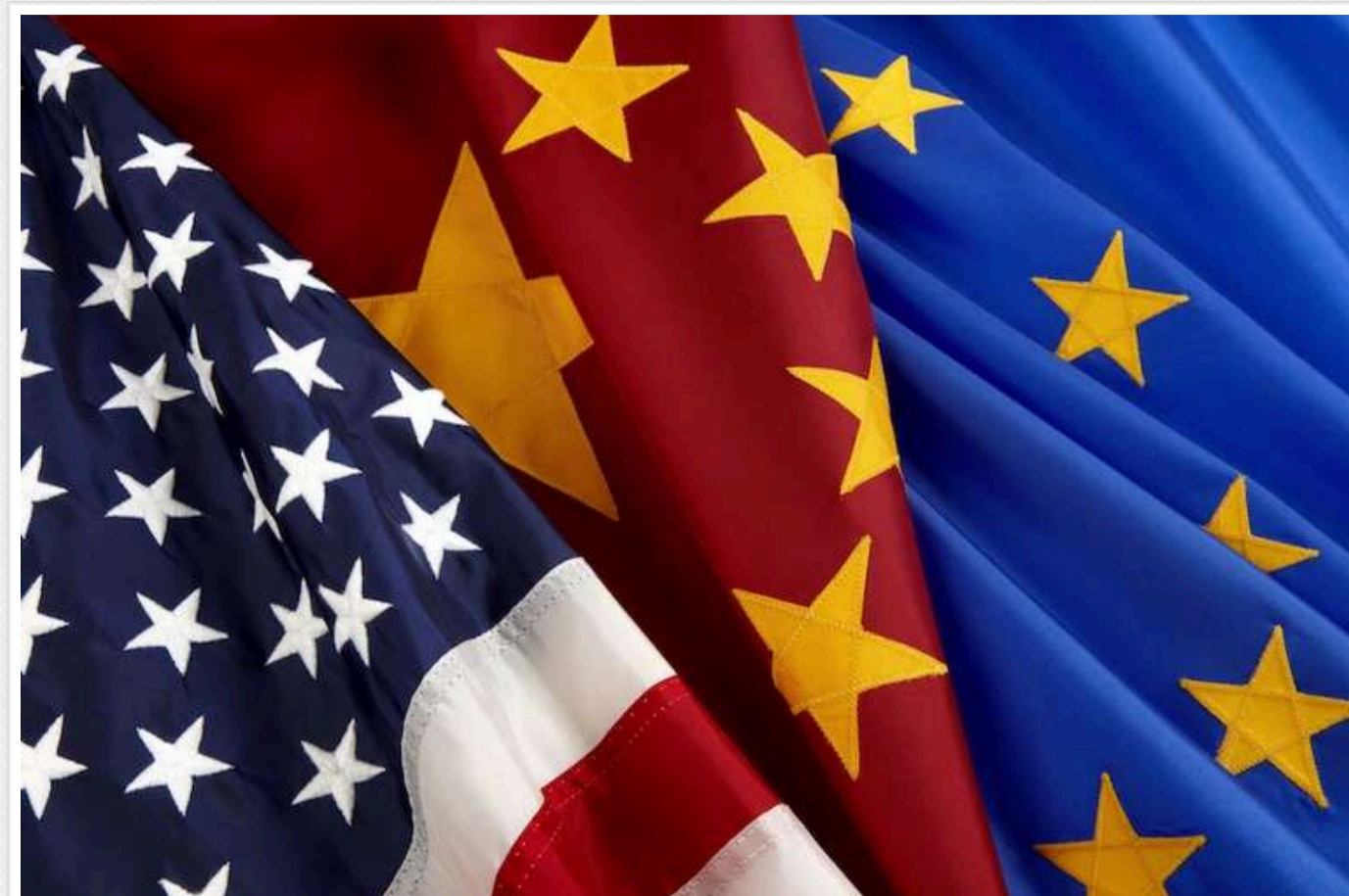
Європейський Союз стикається з вибором між США та Китаєм

Лідери Європейського Союзу, вирушаючи до Давосу на Всесвітній економічній форум, стурбовані складним вибором між США та Китаєм, до якого їх підштовхує Дональд Трамп, повідомляє Politico.