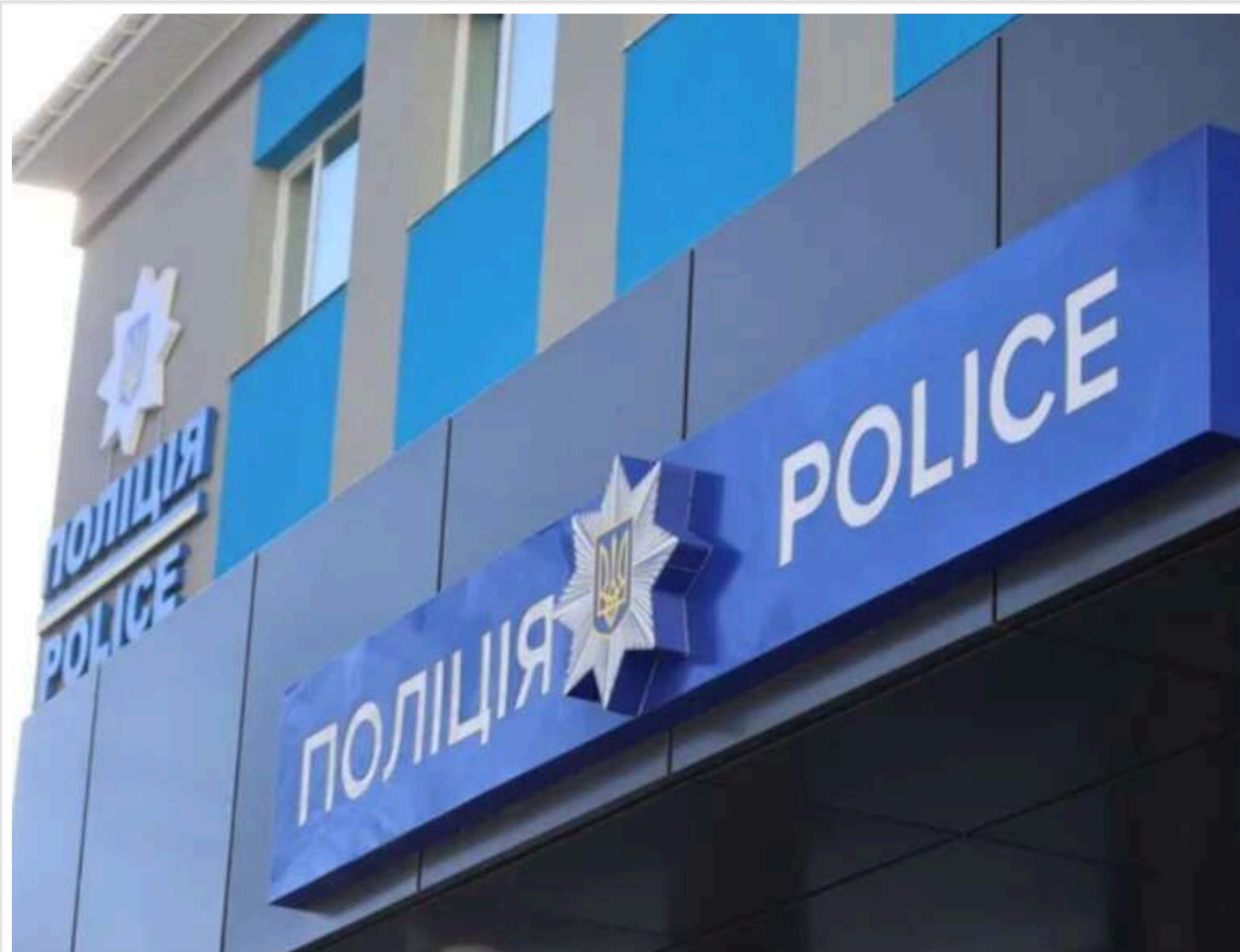
У Білій Церкві група підлітків жорстоко побила 12-річну дівчинку: поліція розпочала розслідування

У місті Біла Церква Київської області група підлітків напала на 12-річну дівчинку. Вони знімали свої дії на телефон.