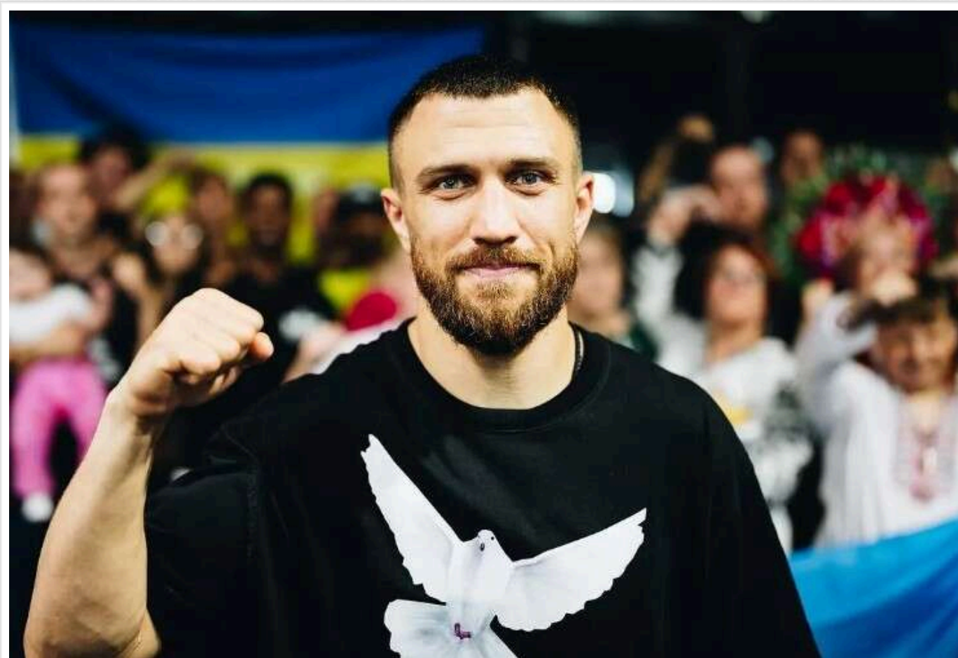
Валуєв запропонував Ломаченку "притулок" у Росії та розкритикував патріотизм Усика

Екчемпiон світу у суперважкій вазі Микола Валуєв висловив своє захоплення Василем Ломаченком, який, за інформацією ЗМІ, інвестував у компанію російського бізнесмена Аркадія Новікова.