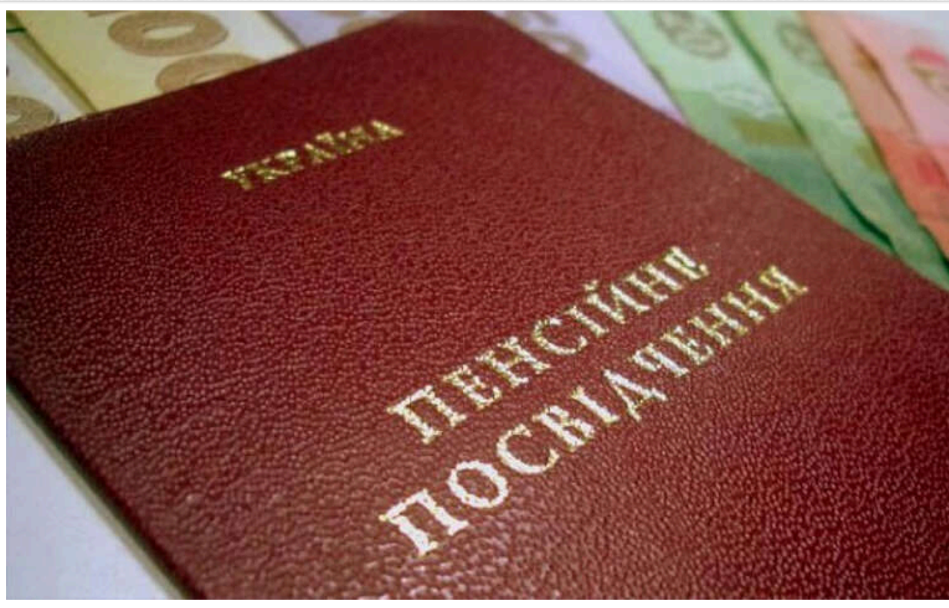
У 2025 році Рада планує запустити накопичувальну пенсійну систему

У 2025 році Верховна Рада планує ухвалити законопроект щодо накопичувальної пенсії ("другої пенсії"), яка стане доповненням до солідарної системи. Протягом трьох перехідних років внески зберігатимуться у державному фонді, а розмір виплат залежатиме від накопичених коштів на індивідуальних рахунках.