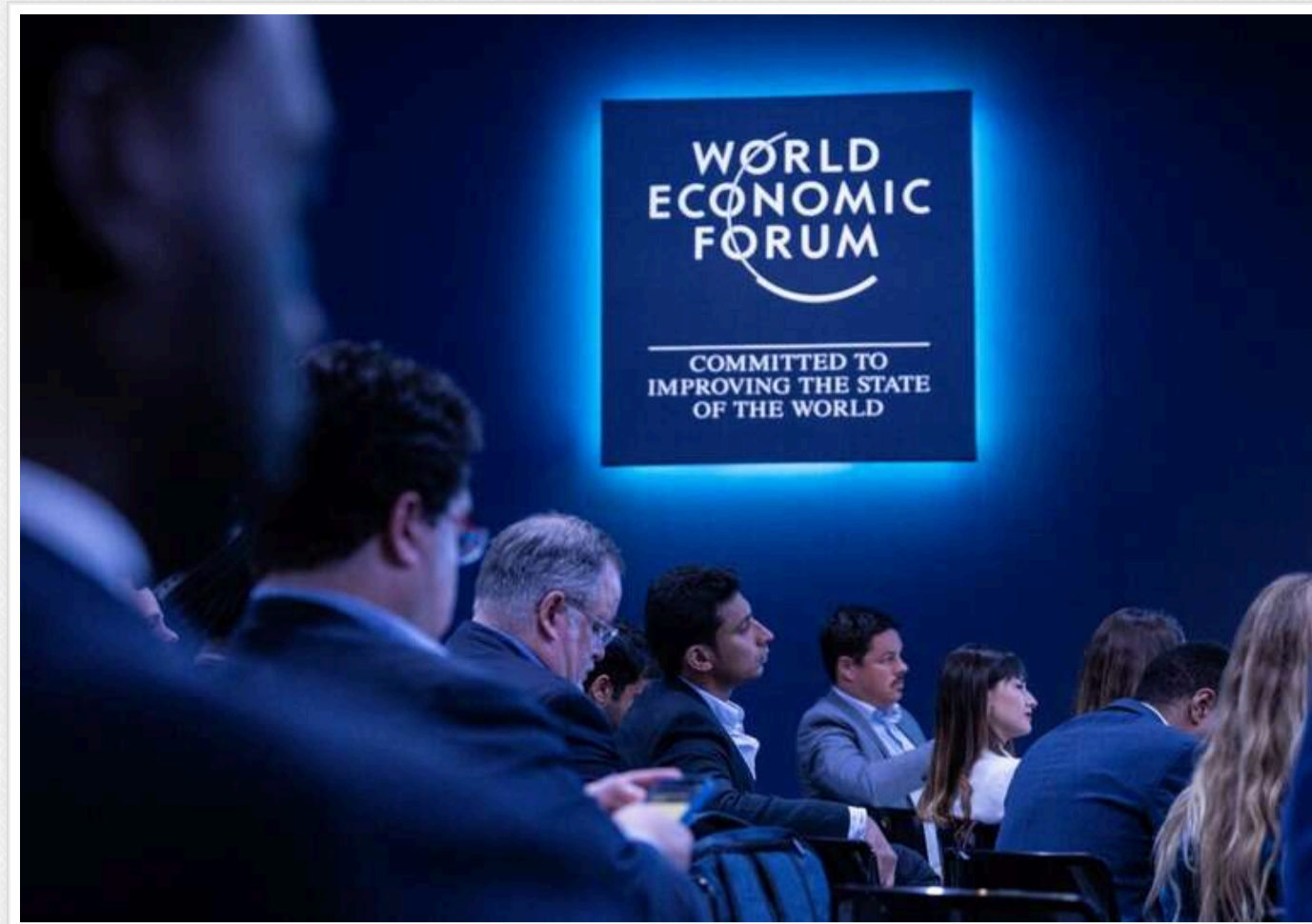
У Давосі стартує Всесвітній економічний форум

Сьогодні, 20 січня, у швейцарському Давосі розпочинається Всесвітній економічний форум (ВЕФ).